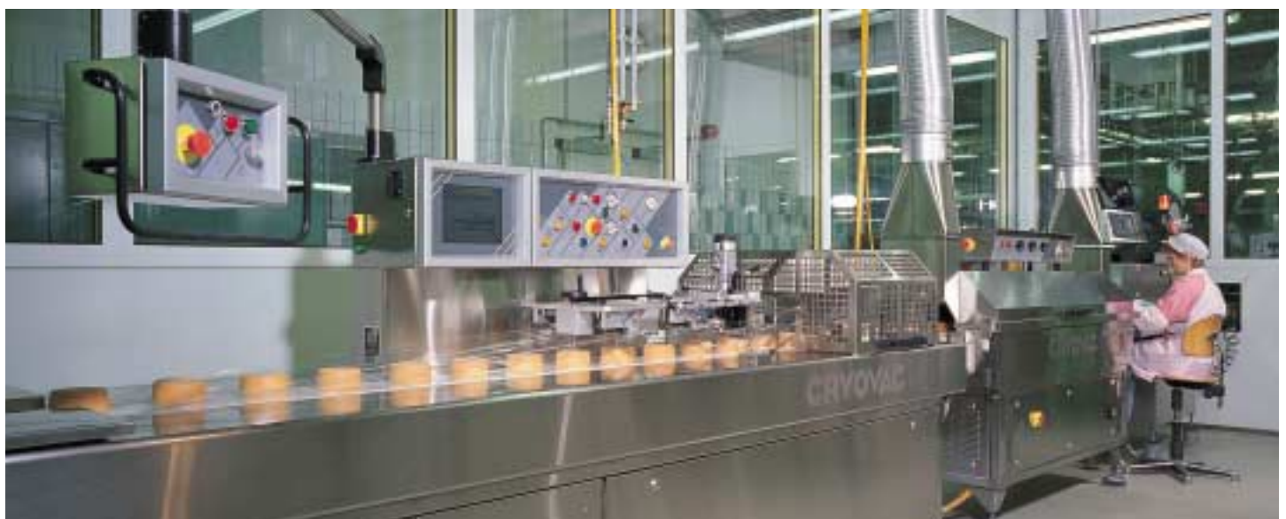
Sistema Cryovac CJ55